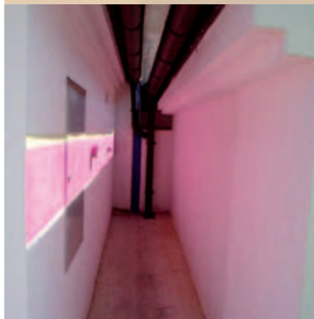
„Lichtsituation um 12 Uhr 20 Min.“ in einem Zwischenraum

Prirodzené svetlo prenáša do svojich obrazov, jej obrazy svietia v tme. Štruktúry z bodov, línií a plôch – predstavujú za denného svetla zakódované posolstvá umelkyne, vyzývajú zmysly diváka, podávajú správu o svete, racionálnom a pocitovom nás; v tme oslovujú oveľa naliehavejšie ako za svetla. Hra svetla a tmy mení významy. Za svetla nepodstatné medzipriestory, medzery, prestávky