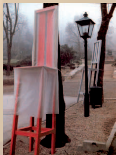
Stolčka/Sessel | No. 21

Dieser ständige Wechsel zwischen Sichtbarem und Unsichtbarem, das Ineinanderfließen von Farben und Licht, die strenge geometrische Steuerung der Wahrnehmung der aufs genaue vorprogrammierten Bilder ist das Wahrzeichen ihres Schaffens.